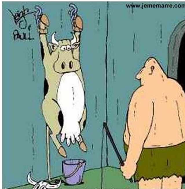
L'horrible vérité sur la crème fouettée